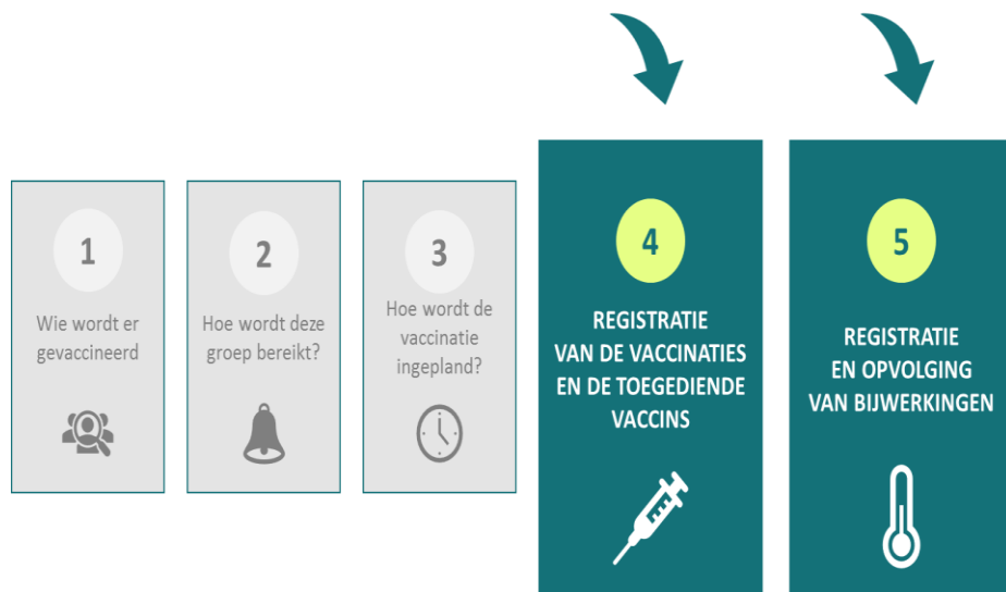
Afbeelding –Vaccinnet in het kader van Covid-19 vaccins

Alle registraties moeten centraal beschikbaar en raadpleegbaar zijn, daarom wordt Vaccinnet uitgerold naar alle gemeenschappen in België. Dit wil zeggen dat ook Wallonië, Brussel en de Duitstalige Gemeenschap de Covid-19 vaccinaties registreren in Vaccinnet vanaf 5 januari. De samenwerking tussen alle gemeenschappen rond Covid-19 vaccinatie wordt om die reden Vaccinnet+ genoemd.